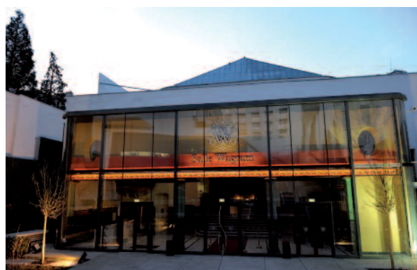
Salle Wagram 39-41, avenue Wagram - 75017 Paris